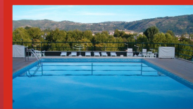
Hotel Aquae Flaviae - Chaves

Telf: 00351 276 309 000 comercial.haf@hoteis-arco.com