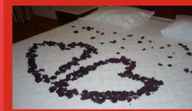
Hotel São Lázaro - Bragança

Alojamento - Consultar condições especiais directamente com cada unidade